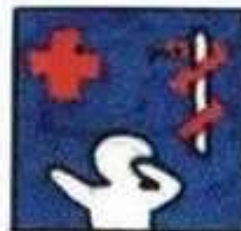
Конвенція ООН про права дитини Ст. 24

Д іти мають право на медичну допомогу за найвищими стандартами, які реально може забезпечити держава. Жодна дитина не може бути позбавлена доступу до ефективної охорони здоров'я.